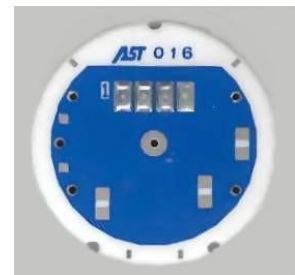
- 比例 1/1 -